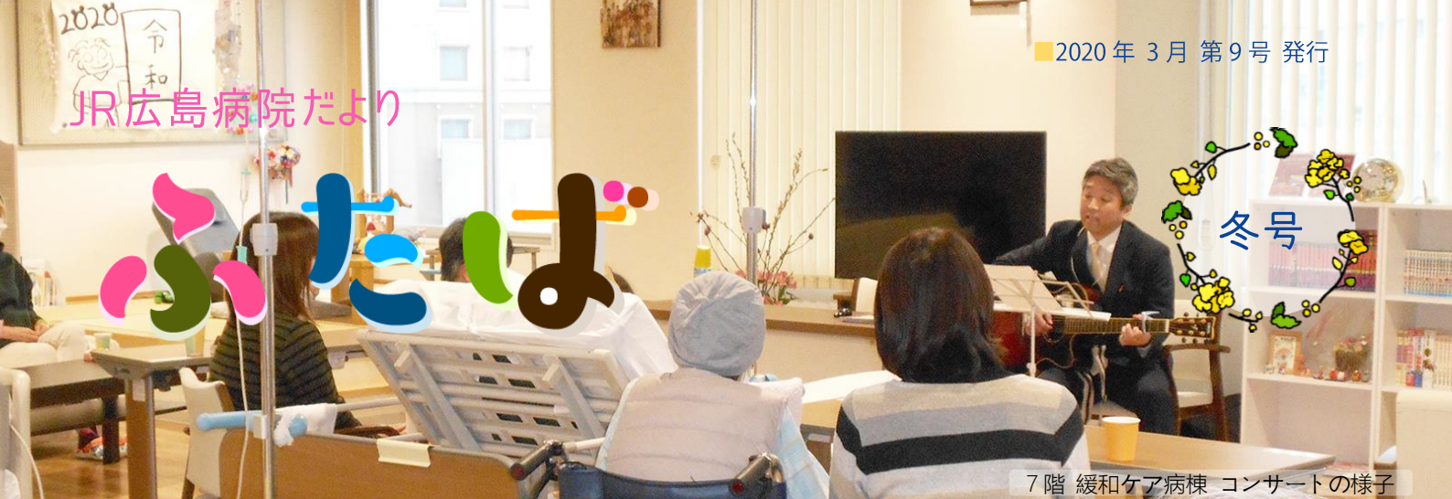
7階 緩和ケア病棟 コンサートの様子