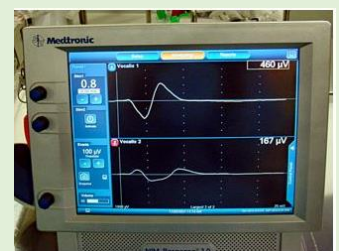
本体と筋電図波形